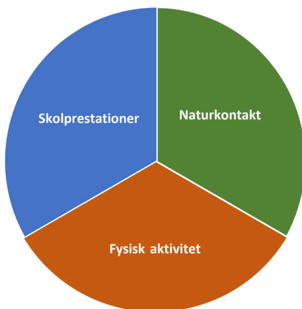
Figur 1. Litteraturgenomgången resulterade i att forskningsmaterialet kunde sorteras i tre huvudkategorier. I kunskapsöversikten redogörs för kunskapsläget utifrån var och en av dessa kategorier, det vill säga utomhusundervisningens effekter på skolprestation, fysisk aktivitet respektive naturkontakt.